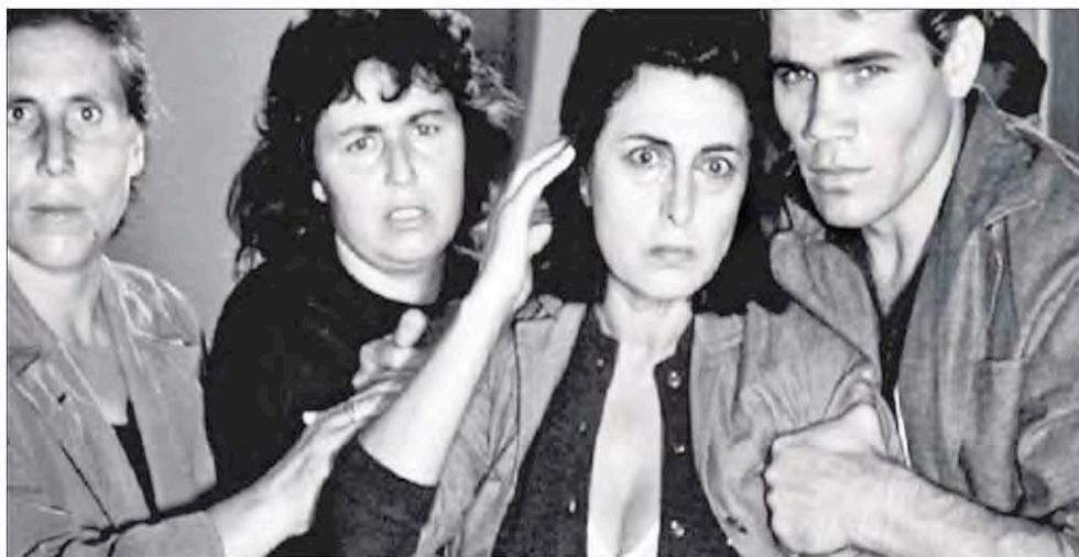
GENILEZZA DE ALFREDO JAAR