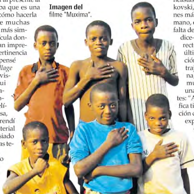
Imagen del filme "Muxima".

dejar fuera muchas cosas importantes. Fue muy doloroso, ya que son elementos esenciales de su biografía y su pensamiento. Es por eso que considero el resultado final nada más que unos fragmentos escogidos de su vida".