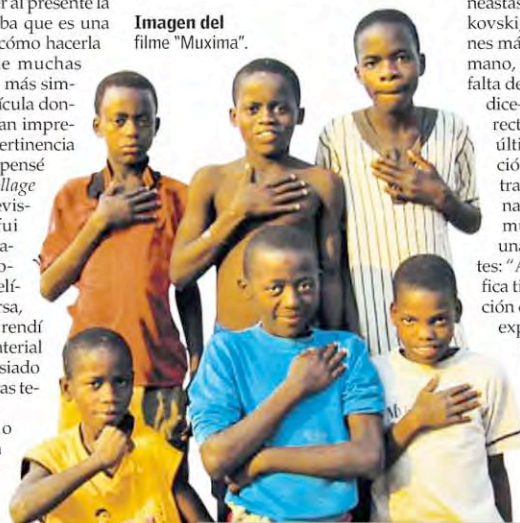
Imagen del filme "Muxima".

dejar fuera muchas cosas importantes. Fue muy doloroso, ya que son elementos esenciales de su biografía y su pensamiento. Es por eso que considero el resultado final nada más que unos fragmentos escogidos de su vida".